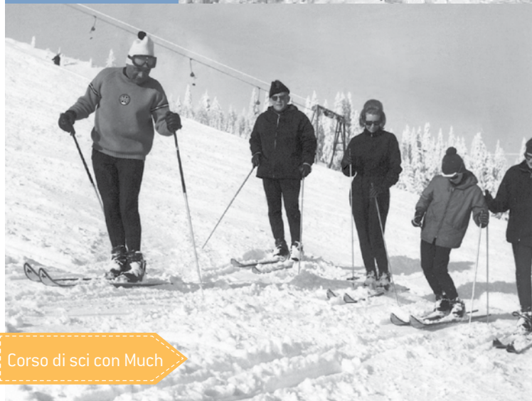
Corso di sci con Much