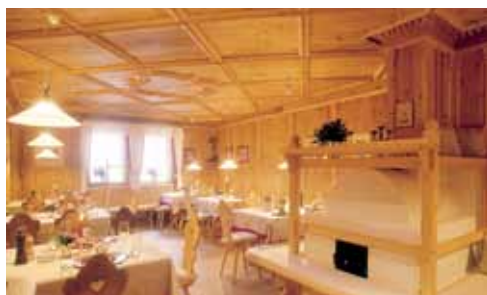
"Stube" accogliente con stufa.