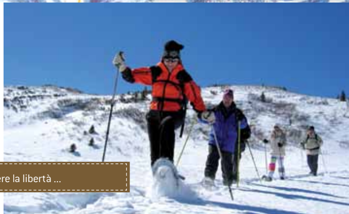
Vivere la libertà ...

Vicino all'albergo si innestano due anelli: uno di 3,5 km e un altro in alta quota di 15 km. Il carosello di sci da fondo della Val Pusteria vi aspetta con 200 km di piste. Passo Monte Croce è stato il luogo degli allenamenti della squadra norvegese di biathlon con Ole Einar Björndalen (Campione del mondo ad Anterselva nel 2007).