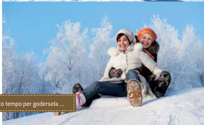
Tanto tempo per godersela ...