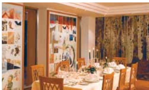
Il moderno ristorante "Regno dei Nani", disegnato dall'artista altoatesino Florin Kompatscher.

Nessun piacere è transitorio... perché la sensazione che lascia è permanente! Goethe