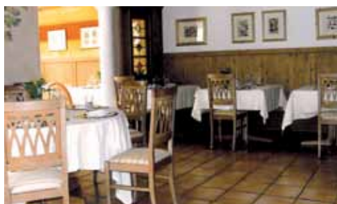
Ristorante "Orangerie" – arredato con legno.