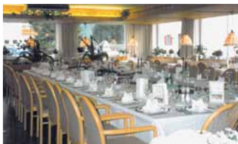
Ristorante "Vista Montagne" – un ambiente luminoso e accogliente con vista sulle cime.