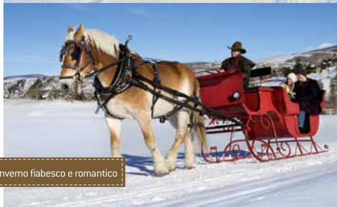
Un inverno fiabesco e romantico