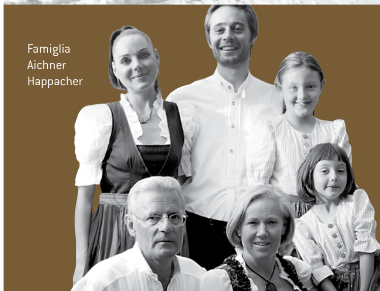
Famiglia Aichner Happacher